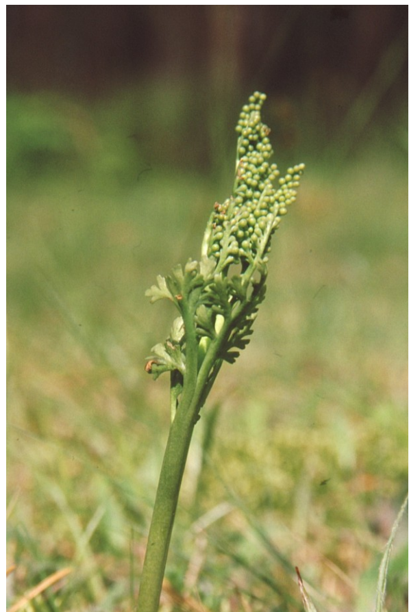
Abb. 1: Botrychium matricariifolium